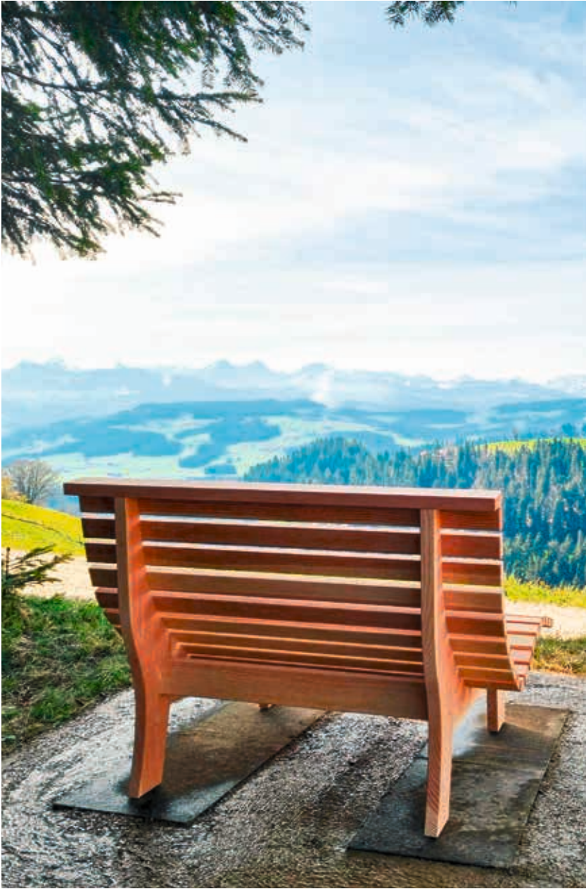
Liegebank auf Waldhäusern.