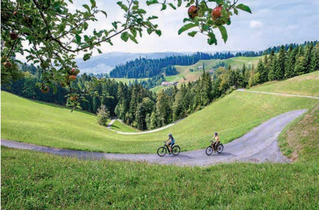
Herzschleife Gotthelf (Emmental Tourismus)